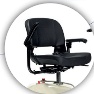
ASIENTO PIVOTANTE Equipado con un bolsillo detrás