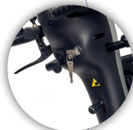
COLUMNA DE DIRECCIÓN Ajustable para una mejor conducción