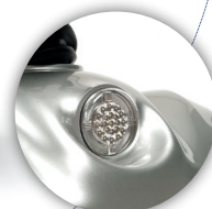
SISTEMA DE LUCES LED Luces LED frontales y traseras con intermitentes