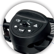
DISPLAY Fácil de usar