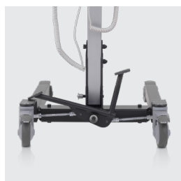
Ruedas traseras con freno