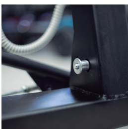
Fácil plegado · Quick Release

*Distancia entre los interiores de las patas delanteras (espacio efectivo de apertura).