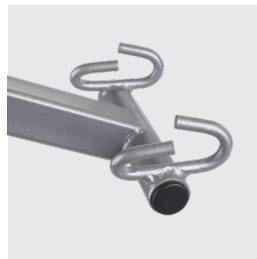
Percha con 4 puntos